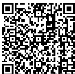
添文ナビ使用方法